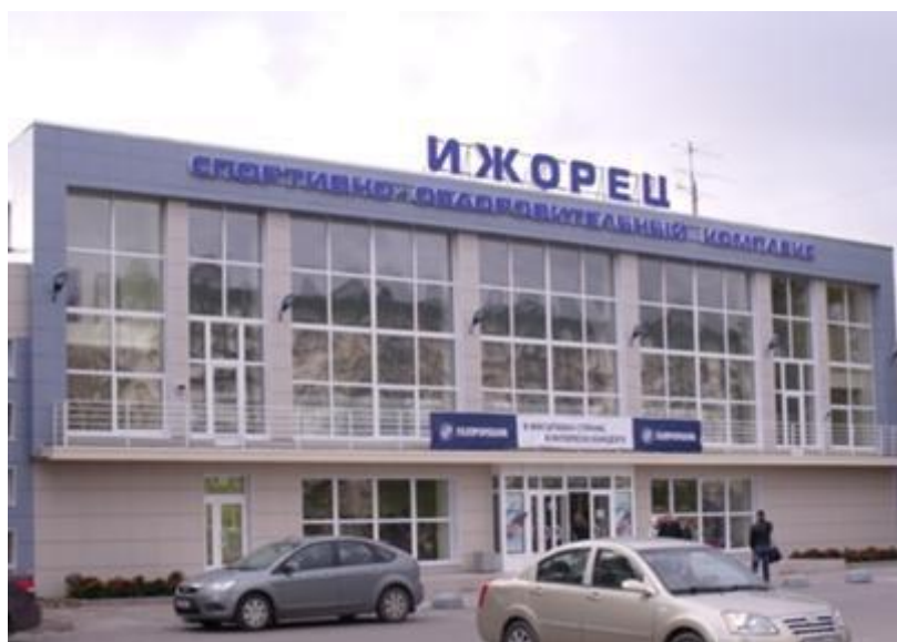
Спортивно-оздоровительный комплекс «Ижорец» в г. Колпино