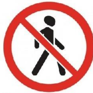
Движение пешеходов запрещено

«Движение пешеходов запрещено» - запрещающий знак.