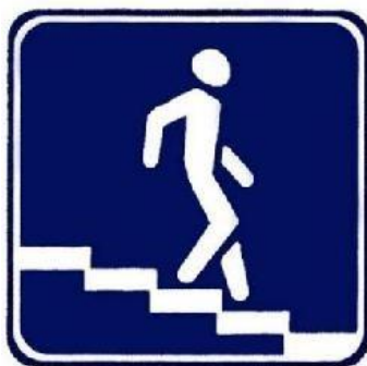
Подземный пешеходный переход

Обратите внимание ребенка, что есть еще один такой же знак, но треугольный. Он предупреждающий (треугольный) знак, который также называется «Пешеходный переход». Он не обозначает место перехода для пешеходов, а предупреждает водителя о приближении к переходу.